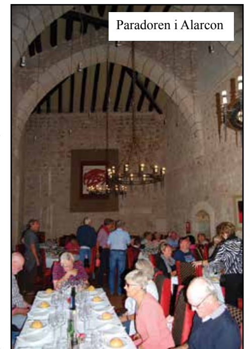
Paradoren i Alarcón