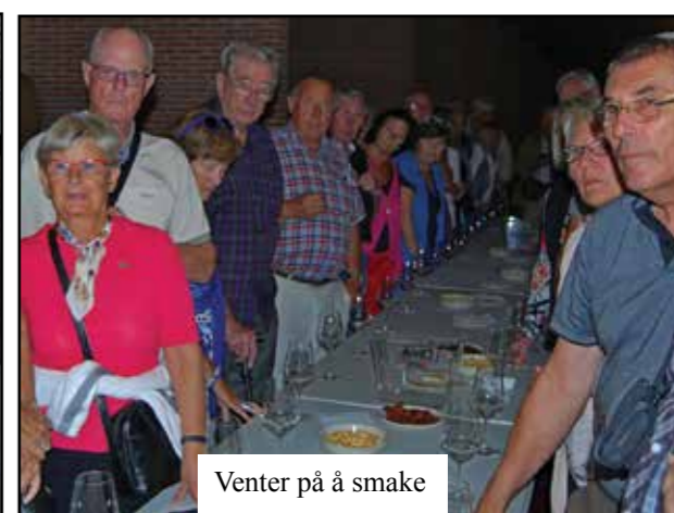
Venter på å smake

som ble bestilt som salat og kylling, var kokte grønnsaker og fisk. Men vi slappet godt av med en Gin Tonic i baren etterpå, og fikk oss en god natts søvn.