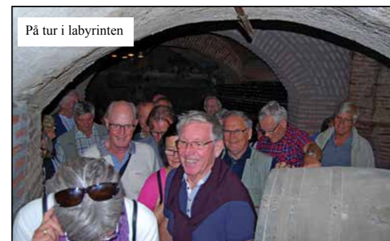
På tur i labyrinten