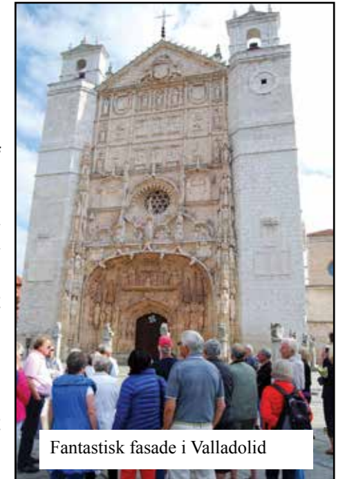
Fantastisk fasade i Valladolid

Vi åpnet dag 4 med en lang byvandring i Valladolid, og etter et par slitsomme timer inntok vi lunsj