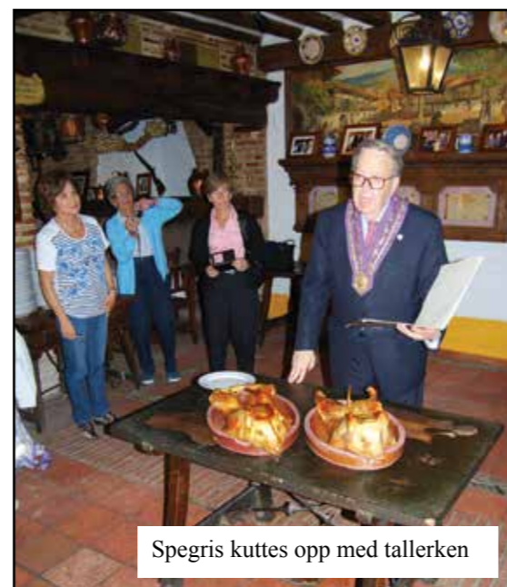
Spegris kuttes opp med tallerken