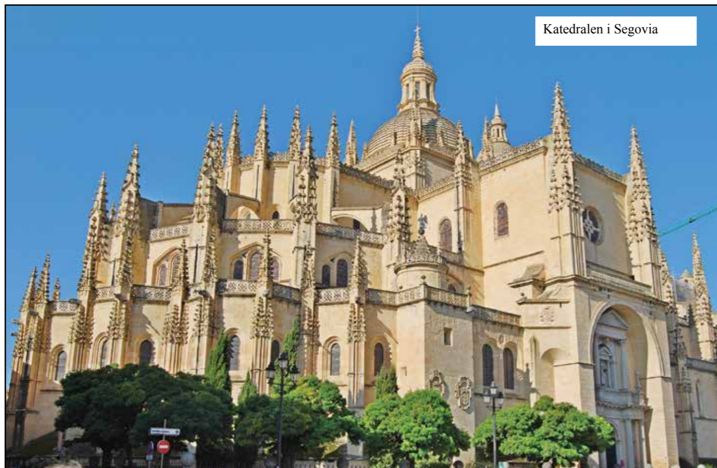
Katedralen i Segovia

Deretter gikk turen mot Cuenca, der vi, etter å ha snirklet oss gjennom byen og opp i fjellene, endelig ankom vårt noe snodige hotell godt utpå kvelden. Middagen,