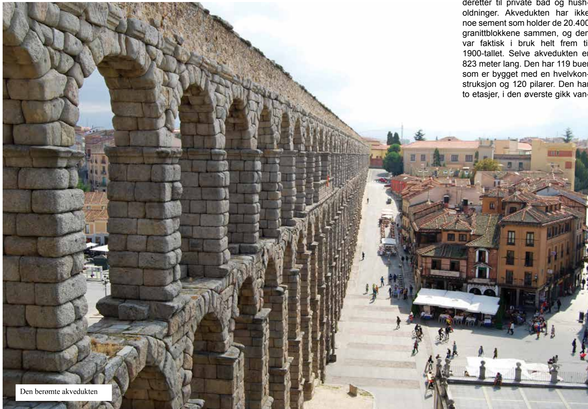
Den berømte akvedukten

Vi var 45 deltagere i vår beste alder som gikk på bussen en tidlig morgen ved Klubben og satte kursen nordøstover til vindistriktet Ribera del Duero og byen Valladolid, der vi skulle bo i tre netter.