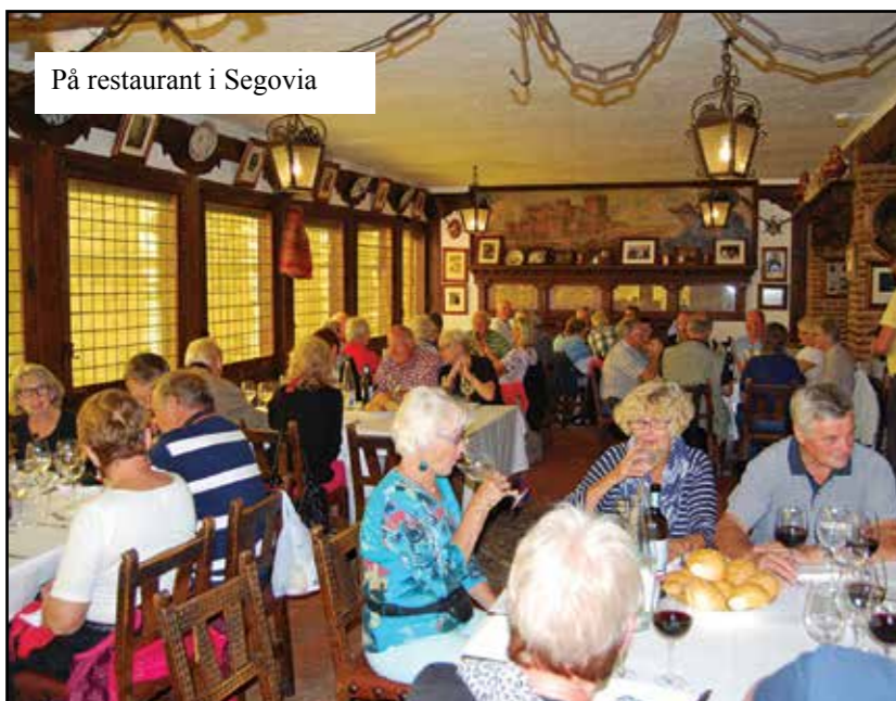
På restaurant i Segovia